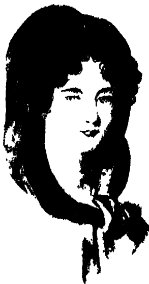
ألبن دو مونطولون.

كلا. فورشوفود لن يكتب شيئاً. على أية حال، فهذا ليس دوره، فهو باحث وليس محققاً. على أية حال التسمم واضح، فأي طبيب أو خبير في السموم سوف يفهم ذلك؟ فورشوفود كان مخطئاً. بعدها بأربعة أعوام كرّس حياته للبحث عن قاتل نابليون.